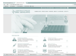
Vista de nuestra pagina web

Así como los pacientes, los profesionales médicos serán provistos de un usuario y clave única con el fin de que puedan acceder mediante nuestra web, a la visualización de protocolos pertenecientes a sus pacientes. Esto asegurara que si el medico posee un